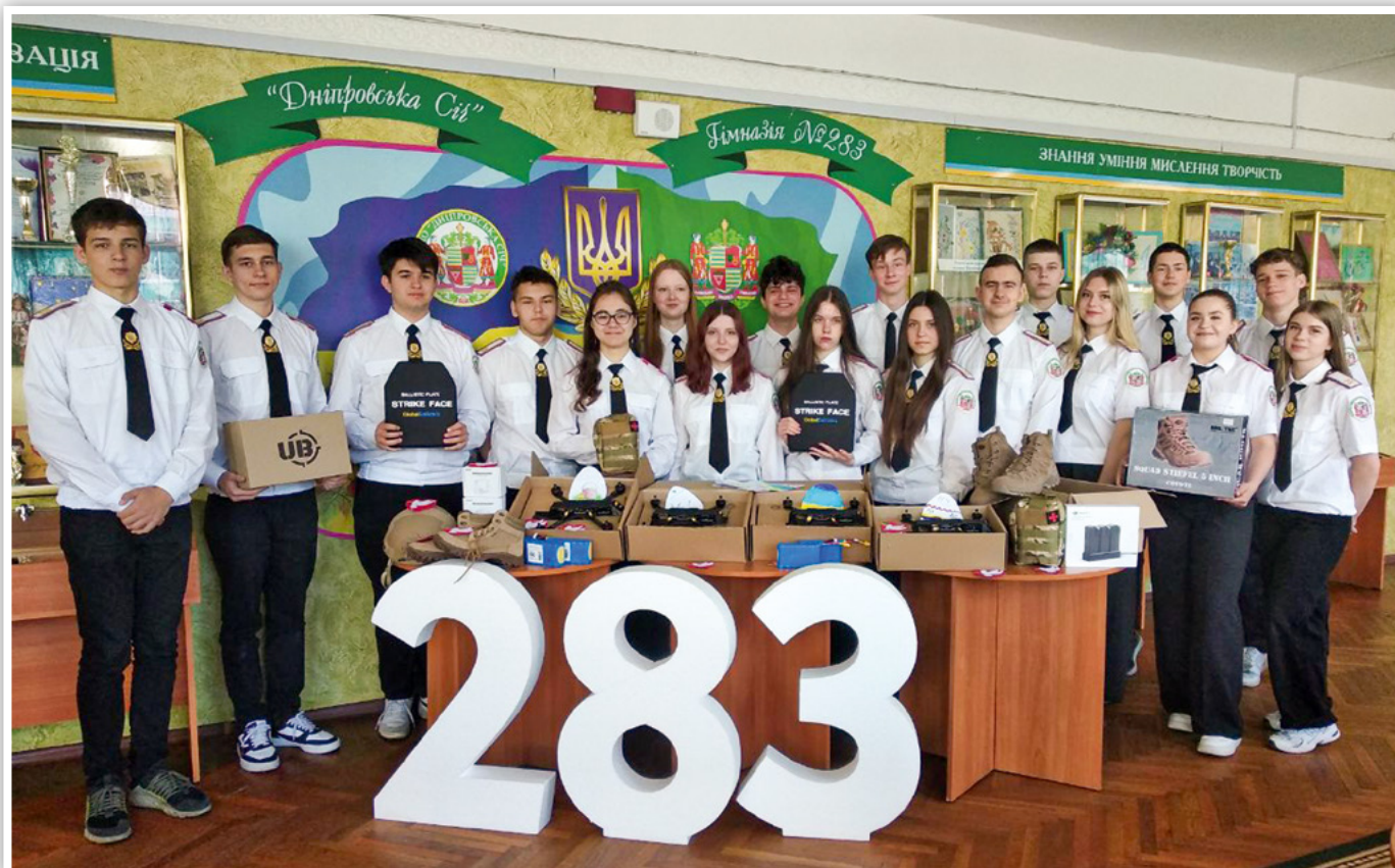
Для Збройних сил України за кошти з благодійної ярмарки придбали FPV-дрони, батареї «Мавік», FPV (ємність 9000), турнікети, аптечки, амуніцію, плитоноски