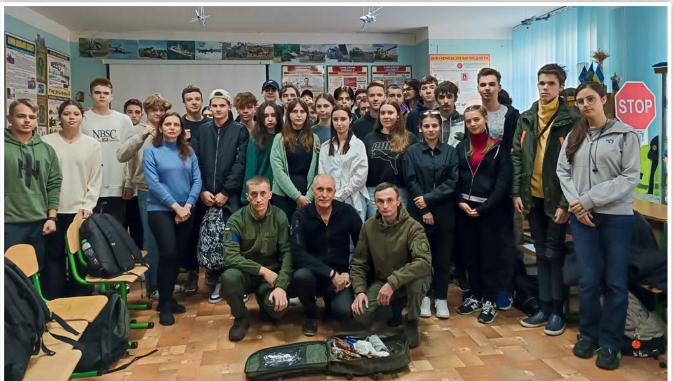
Заняття з тактичної медицини для учнів гімназії проводять бойові медики Національної гвардії України